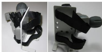
Figure 15-8 EV1000 Power Adapter Bracket