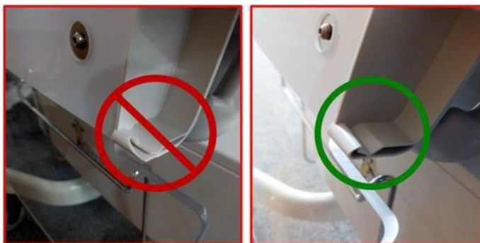
Slika 1C - polomljen zapah