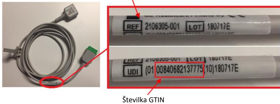
Slika 2: Mesto ref./kataloške številke in številke GTIN na etiketi embalaže prizadetih povezovalnih in vodilnih kablov.

Embalaža povezovalnih in vodilnih kablov za EKG ref./kataloška številka (etiketa na embalaži)