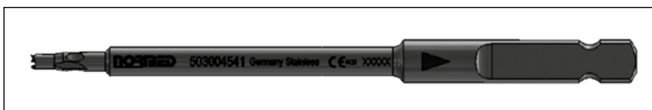
Slika 1: Pogled instrumenta grezila z AO

Proizvajalec: Normed Medizin Technik GmbH (kot je navedeno v Prilogi 2)