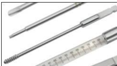
Slika 3: Pogled navojnega svedra

Družba Zimmer GmbH pošilja varnostno obvestilo glede umika (odpoklica) medicinskega pripomočka za specifične instrumente, ki jih je prej proizvajala in označevala družba Normed Medizin Technik GmbH, kot je navedeno v prilogi 2. Ta varnostni ukrep obsega vse serije, ki jih je ta družba proizvedla. Ta odpoklic velja le za instrumente, označene z imenom/logotipom »Normed«. Potencialno prizadete izdelke lahko prepoznate tako, kot je navedeno v prilogi 1 (ali neposredno na podlagi oznake na nesterilnih instrumentih ali na podlagi oznak za sterilne instrumente). Če se soočite s kakršnimi koli težavami pri ustrezni identifikaciji potencialno prizadetih instrumentov, se za podporo obrnite na predstavnika družbe Zimmer Biomet.