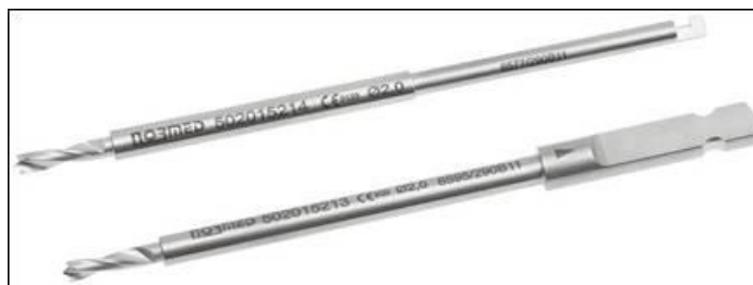
Slika 2: Pogled svedrov