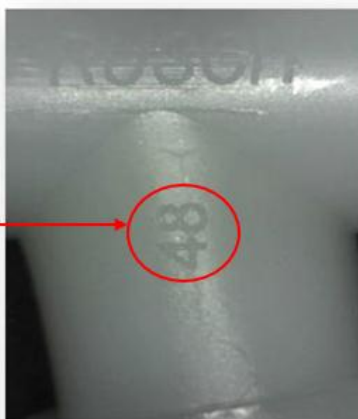
Slika 2 – Identifikacijska številka (ID)