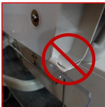
Slika 1 - Polomljeno zapiralno mehanizem