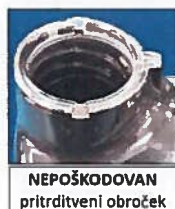
NEPOŠKODOVAN pritrditveni obroček

Slike prikazujejo nepoškodovan pritrditveni obroček, v primerjavi s poškodovanim oziroma manjkajočim.