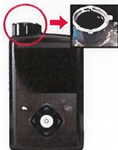
Slika: Mesto pritrditvenega obročka na Inzulinski črpalki MiniMed serije 600

Slike prikazujejo nepoškodovan pritrditveni obroček, v primerjavi s poškodovanim oziroma manjkajočim.