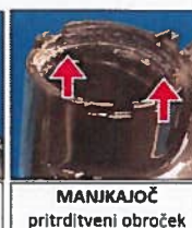
MANJKAJOČ pritrditveni obroček