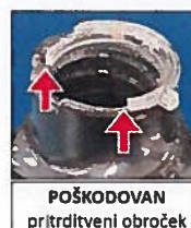
POŠKODOVAN pritrditveni obroček