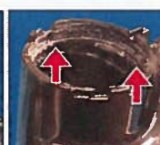
MANJKAJOČ pritrditveni obroček