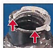
POŠKODOVAN pritrditveni obroček