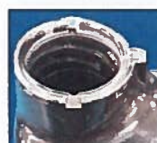
NEPOŠKODOVAN pritrditveni obroček

Slike prikazujejo nepoškodovan pritrditveni obroček, v primerjavi s poškodovanim oziroma manjkajočim.