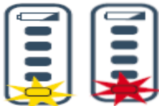
Slika 2: Prikazovalnik polnjenja akumulatorja

Enote Giraffe Shuttle NE uporabljajte za transport, če prikazovalnik za polnjenje akumulatorja prikazuje samo eno rumeno lučko ali samo RDEČO utripajočo lučko, kot je prikazano na sliki 2. Pred uporabo poskrbite, da je enota Giraffe Shuttle ustrezno napolnjena za transport.