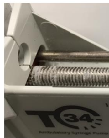
Slika 1: Glavni vijak in beli drobci plastike