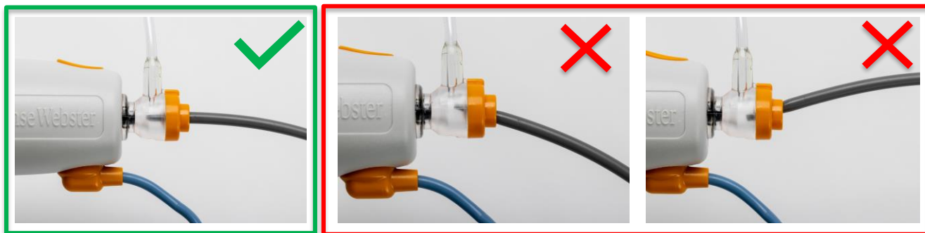
a. Pravilno vstavljanje dilatatorja