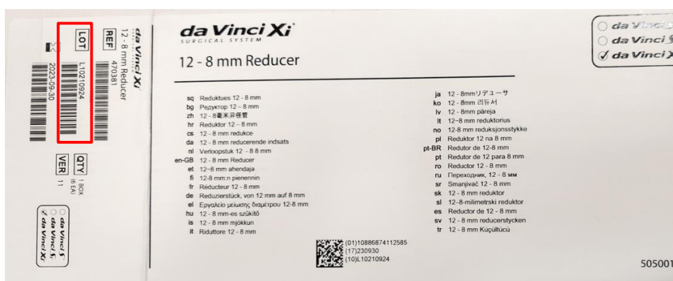
Slika 3: Primer lokacije številke serije na oznaki notranje škatle