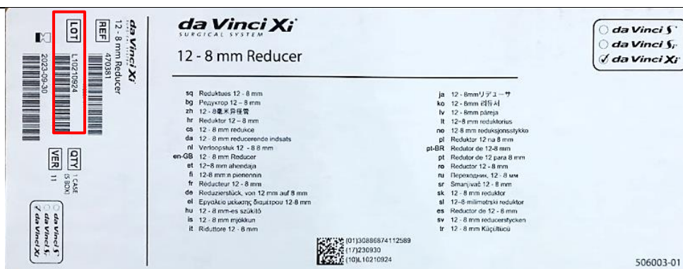
Slika 2: Primer lokacije številke serije na škatli pošiljatelja