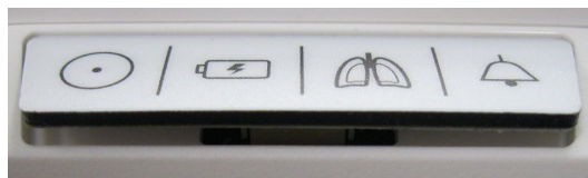
Slika. 1 Zrahljana plošča