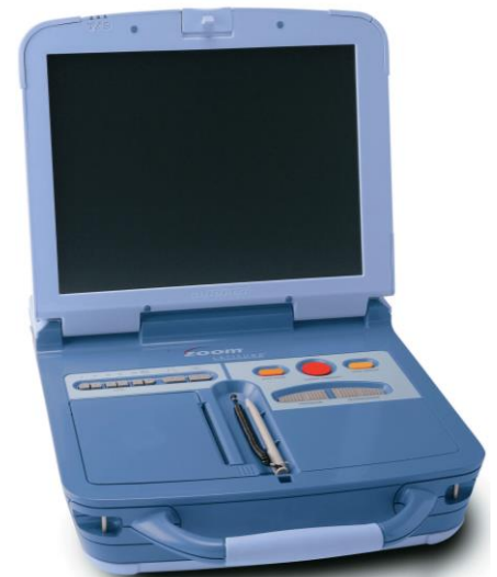
Slika 1. Kontrolna naprava Model 3120 ZOOM