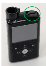
Pokrovček baterije je na vrhu črpalke, kjer je predel za vstavev baterije AA.

Pokrovček baterije črpalke je sestavljen iz plastičnega pokrovčka in kovinskega kontakta, ki skupaj z baterijo AA napaja črpalko. Kovinski kontakt na mestu ohranjajo tri dvignjene, okrogle, črne, plastične pike, kot je prikazano na spodnji sliki. Če se kovinski kontakt razrahlja ali pade s pokrovčka baterije, lahko pride do prekinjenega kontakta baterije, zaradi česar se črpalka ne napaja. Ko črpalka zazna, da ni vira napajanja, se sproži alarm za vstavev baterije, dovajanje inzulina pa se takoj zaustavi . Po 10 minutah se zvok alarma lahko spremeni v sireno in črpalka se izklopi .