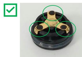
Nepoškodovan pokrovček baterije - nadaljujte uporabo Tri dvignjene, okrogle, črne, plastične pike, ki kovinski kontakt ohranjajo na mestu in so prisotne.