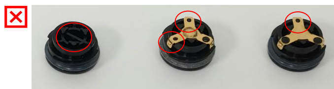
Poškodovani pokrovčki baterije - ne uporabljajte Kovinski kontakt manjka ali pa so prisotne manj kot 3 dvignjene pike.