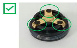
Nepoškodovan pokrovček baterije - nadaljujte uporabo Tri dvignjene, okrogle, črne, plastične pike, ki kovinski kontakt ohranjajo na mestu in so prisotne.