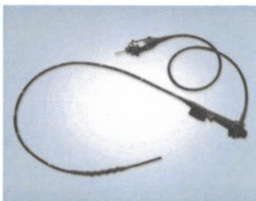
INTESTINALNI VIDEOSKOP PSF-1