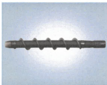
CEV POWERSPIRAL DPST-1