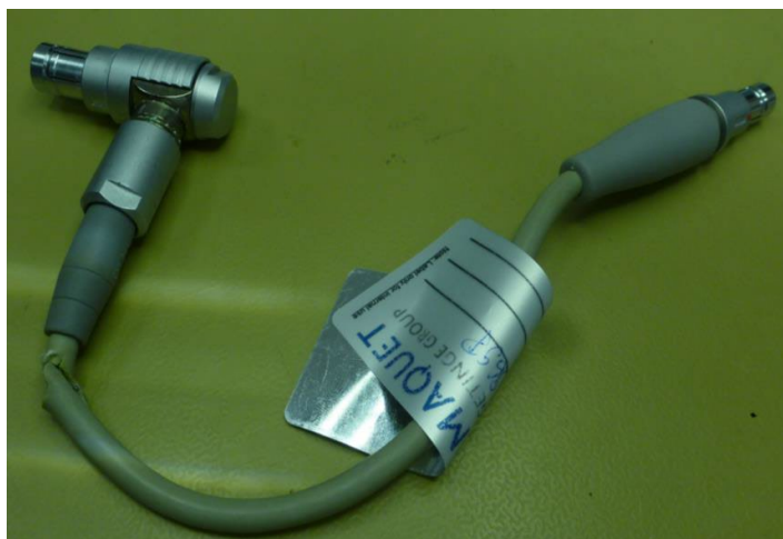
Slika št. 2: Primer s terena – razpokan izolacijski material na kablu

Težava s kakovostjo, ki jo preiskujemo, se nanaša na priključni kabel za venozno sondo, L0,23 m", št. postavke 701048804 (dodatna oprema) in 701069333 (nadomestni del). Sestavni del, ki je vzrok neskladja, ki ga preiskujemo, je odgovoren za prenos podatkov med enoto CARDIOHELP-i in venozno sondo. Opaženo je bilo veliko število primerov razpokane izolacijske prevleke in razpok pri zaščiti povezovalnega kabla na venozni merilni glavi.