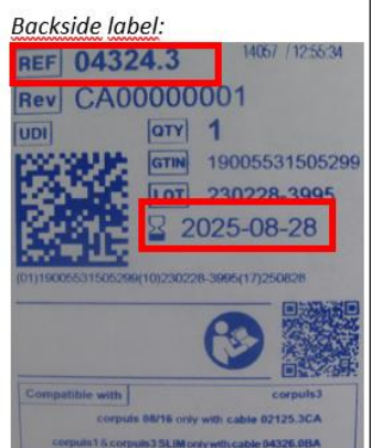
Slika 1 Identifikacija potencialno prizadetega pripomočka na podlagi REF in datuma izteka roka uporabnosti na etiketi, ki je 13. 10. 2025 ali prej (za primer glejte rdeče okvirje, REF 05120.1 predstavlja tudi REF 05120.3, oba pripomočka pre-connect v vrečkah, in REF 04324.3 v trdi embalaži).