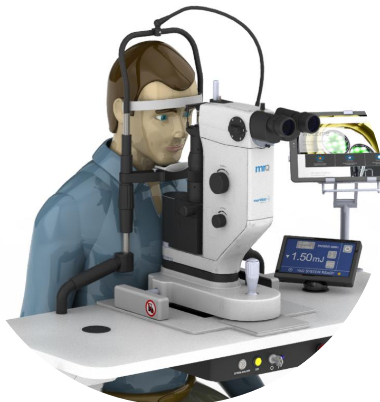
Slika oftalmološkega medicinskega pripomočka MR Q SLT