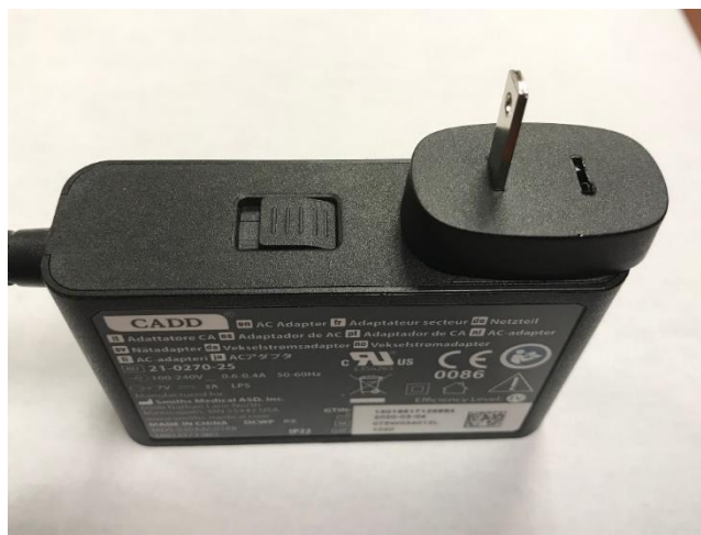
Slika 3: Napajalnik z manjkajočim vtičem