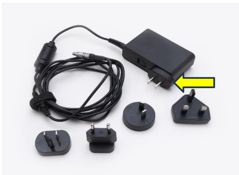
Slika 1: CADD- Solis napajalnik

Vhodni vtič napajalnika, označen na sliki 1 spodaj, se lahko poškoduje ali zlomi. Če je vhodni vtič poškodovan, so lahko izpostavljeni kovinski kontakti na ohišju napajalnika ali pa se lahko eden ali več omrežnih vtičev loči od vhodnega vtiča.