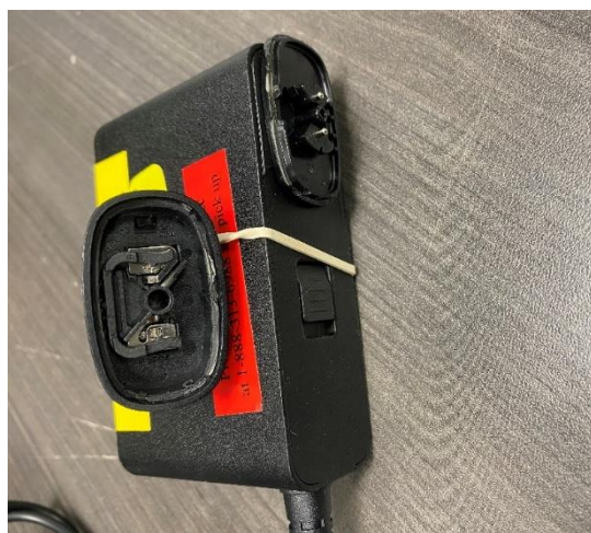
Slika 2: Poškodovan vtič