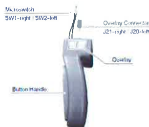
Slika 1 Mikrostikalo in prekrivni priključki na ročaju

Če uporabnik med čiščenjem ali razkuževanjem sistema MobileDiagnost wDR uporabi prekomerno količino tekočine ali če tekočino razprši neposredno v sistem, lahko tekočina prodre v robove gumbov ročaja in povzroči korozijo kovine ali električni kratek stik na prekrivnem priključku (glejte sliko 1). Sistem ima na ročajih štiri (4) gumbе, ki nadzirajo vrtenje vsakega kolesa za premikanje (naprej/nazaj). Če zaradi te težave pride do električnega kratkega stika, se lahko sistem sam počasi premika (20 cm/s). Pri tej hitrosti se lahko oseba ali mimoidoči zlahka odmakne od sistema, ne da bi se poškodoval. Uporabnik lahko z lahkoto dostopa do gumba za zaustavitev v sili in zaustavi premikanje sistema. Do te težave ne pride, ko se tekočina posuši .